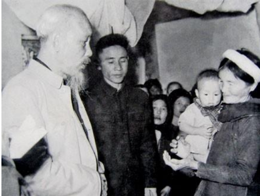
Ảnh tư liệu

Thấy người lạ, mấy em quay ra nhìn tôi. Em lớn, cặp mắt như dò hỏi nhưng vẫn lễ phép: