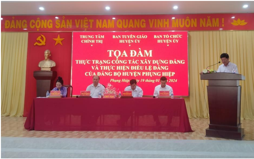
Huyện Phụng Hiệp tổ chức tọa đàm về công tác xây dựng Đảng

Tổ chức nghiên cứu, học tập, quán triệt và tuyên truyền Nghị quyết Hội nghị lần thứ 8, Ban Chấp hành Trung ương Đảng, khóa XIII, kết quả, với hình thức trực tuyến và trực tiếp. Trung tâm chính trị các địa phương phối hợp với các cơ quan, ban ngành đăng ký mở các lớp bồi dưỡng, đào tạo năm 2024; bổ sung nội dung