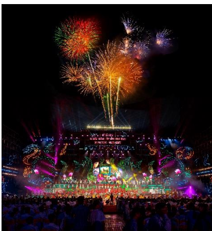
Màn bắn pháo hoa nghệ thuật tại lễ kỷ niệm 20 năm thành lập tỉnh và đón năm mới 2024

Tình hình sản xuất nông nghiệp cơ bản thuận lợi, diện tích gieo trồng, năng suất các loại cây trồng, vật nuôi đảm bảo kế hoạch. Hàng hóa nông sản cung ứng trong dịp Tết Nguyên đán Giáp Thìn năm 2024 được đảm bảo. Trong tháng, thành lập mới 79 doanh nghiệp, số doanh nghiệp đăng ký tạm ngừng hoạt động tăng cao. Sản xuất công nghiệp và doanh thu bán lẻ hàng hóa, dịch vụ lưu trú, ăn uống và doanh thu các loại hình dịch vụ tiêu dùng tăng so với tháng trước và cùng kỳ. Tổng vốn đầu tư phát triển toàn xã hội 2.014,190 tỷ đồng, bằng 113,43% so cùng kỳ và bằng 91,89% so tháng trước. Thu ngân sách nhà nước trên địa bàn là 623 tỷ đồng, đạt 9,91% dự toán Trung ương, đạt 8,31% dự toán Hội đồng nhân dân tỉnh.