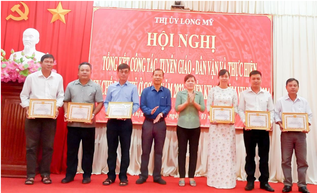
Tổng kết công tác Tuyên giáo – Dân vận tại thị xã Long Mỹ

Trong tháng Ban Tuyên giáo các huyện, thị, thành ủy đã tham mưu cấp ủy ban hành kế hoạch triển khai học tập, quán triệt, tuyên truyền Nghị quyết Hội nghị lần thứ tám Ban Chấp hành Trung ương Đảng khóa XIII; triển khai, quán triệt Chỉ thị số 32-CT/TU ngày 19/12/2023 của Ban Thường vụ Tỉnh ủy Hậu Giang “Về lãnh đạo, chỉ đạo tổ chức đón tết Nguyên đán Giáp Thìn năm 2024 trên địa bàn tỉnh Hậu Giang”; triển khai thực hiện Hướng dẫn số 95-HD/BTGTU ngày 11/12/2023 của Ban Tuyên giáo Tỉnh ủy về thực hiện mô hình “Ngày thứ Sáu tuần cuối tháng nghe dân nói, nói dân hiểu, làm dân tin”; báo cáo tổng kết 20 năm sử dụng Bản tin Thông báo nội bộ của Ban Tuyên giáo Tỉnh ủy; Kế hoạch tổ chức họp mặt kỷ niệm 94 năm ngày thành lập Đảng Cộng sản Việt Nam (3/2/1930 - 3/2/2024) và mừng xuân Giáp Thìn 2024; Báo cáo tổng kết 05 năm công tác Xây dựng Đảng (2021- 2025) và tổng kết 15 năm triển khai thực hiện Điều lệ Đảng (2011 - 2025).