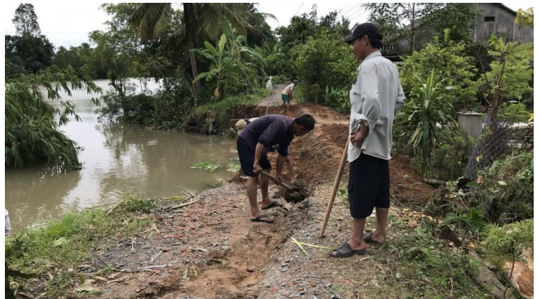
Người dân khắc phục tạm thời hậu quả sạt lở