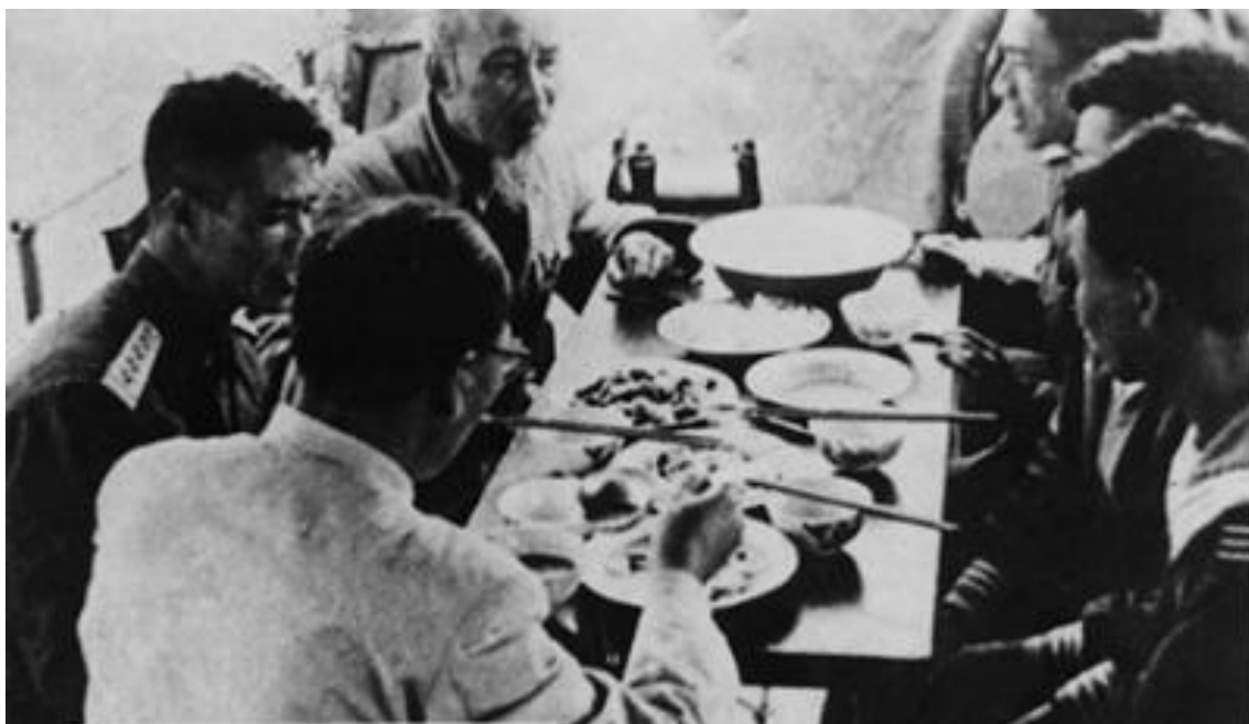
Ảnh tư liệu

Một chiến sĩ bảo vệ Bác - sau này được phong quân hàm cấp tướng - có lần nói rằng: Bác thường dạy quân dân ta “cần, kiệm, liêm, chính, chí công, vô tư”, Bác dạy phải làm gương trước. Bác dạy phải nêu cao đạo đức cách mạng.